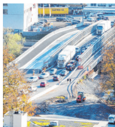
Die Behelfsbrücke hat ausgedient, ab 1. Dezember wird die neue Brücke genutzt.

November ebenfalls befahrbar. In Bau sind auch die neuen Lkw-Abstellplätze direkt neben dem Zollamt Höchst. Das ist kein Parkplatz, hier stehen die Lkw lediglich